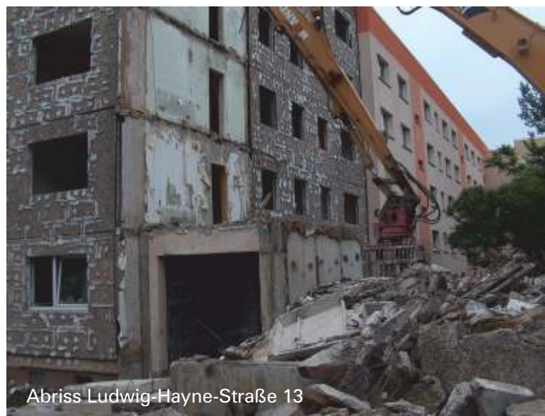
Abriss Ludwig-Hayne-Straße 13