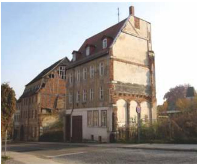
Teichstraße 5-7 vorher

Eine große Herausforderung und ein völlig neues Wohngebiet mit moderner Architektur war für uns und die Stadt Altenburg unser Quartier in der Teichstraße 5-6-7 / Langengasse 20. Die hier entworfenen und entstandenen Grundrisse brachten Neugier und großes Interesse.